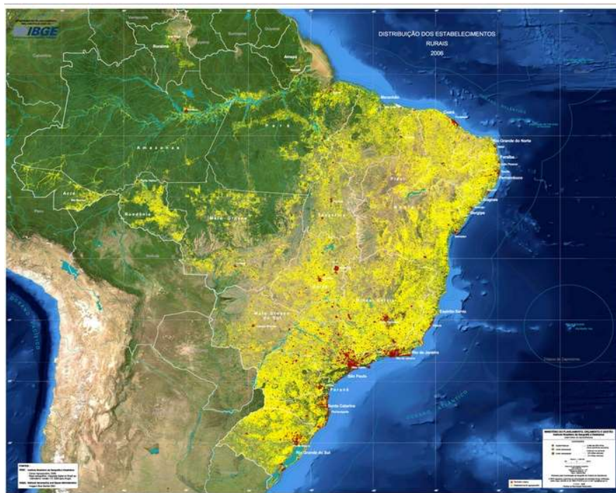
FIGURA 1 - DISTRIBUIÇÃO DOS ESTABELECIMENTOS RURAIS NO BRASIL, NO ANO DE 2006