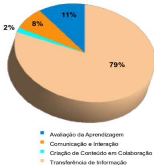
GRÁFICO 2 - PERCENTUAL DE FERRAMENTAS UTILIZADAS